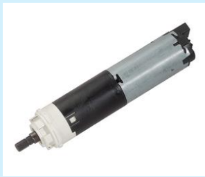
Silnik DC z przekładnią czołową Seria GMPI